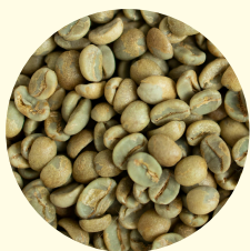
Meer biologische koffie aangekocht