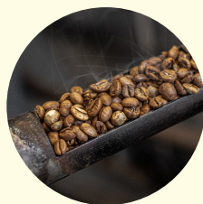
Onze productie energiezuiniger gemaakt