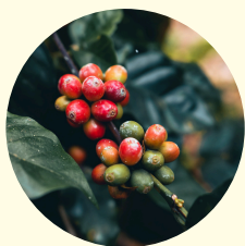
Geïnvesteed in bonen zonder link met ontbossing

Dankzij jouw keuze voor traag gebrande kwaliteitskoffie konden we in 2024 opnieuw stappen zetten naar een duurzamere koffieketen. Achter elke tas koffie schuilt een verhaal van zorg, respect én vooruitgang. Dit is wat jij met mee hebt helpen realiseren 📌